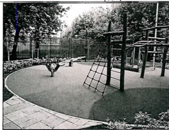
Установка детских и спортивных площадок с безопасным резиновым покрытием