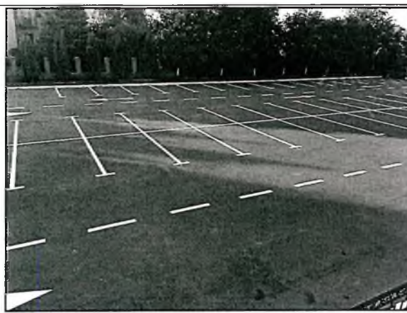
Устройство парковочных пространств