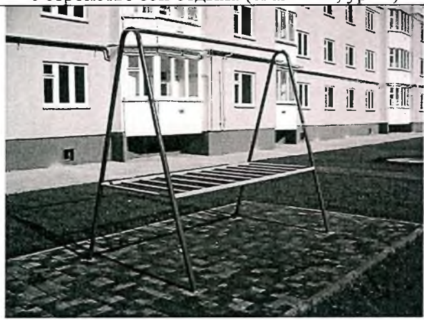
Установка малых архитектурных форм