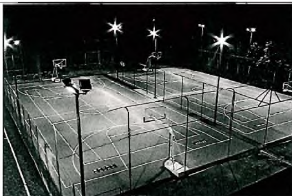
Дополнительное освещение детской и спортивной площадок