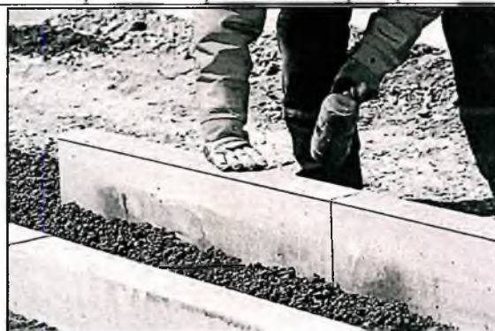
Установка или замена бордюрного камня