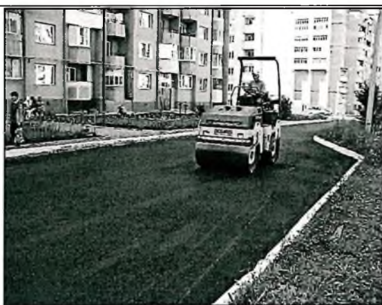
Асфальтирование дворовых проездов