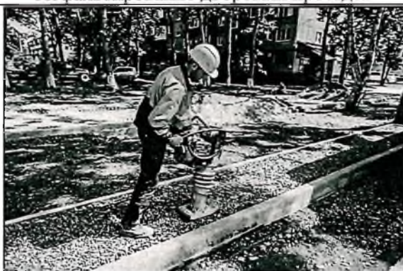
Устройство (ремонт) тротуаров