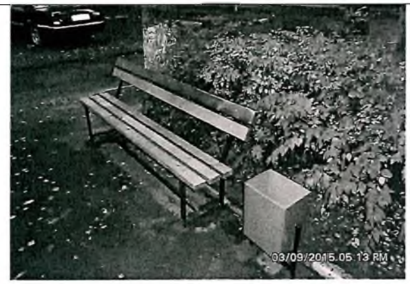
Устройство зон отдыха (скамейки, урны)