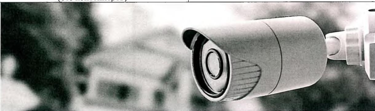
Обустройство систем видеонаблюдения