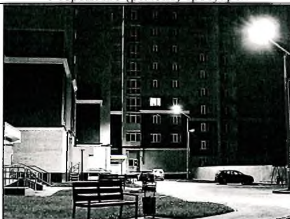
Освещение дворовой территории