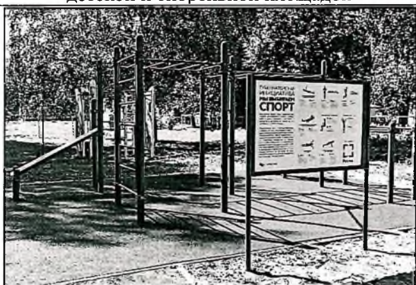
Установка информационного стенда