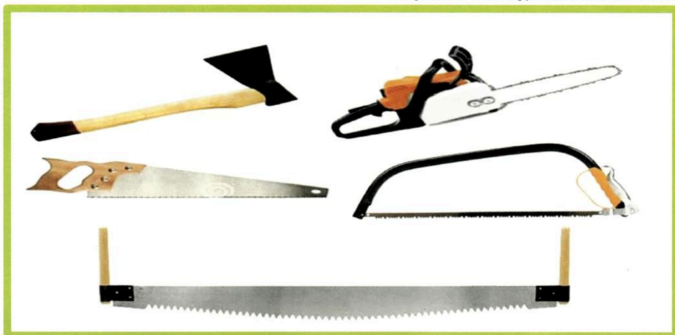
Изображение № 8 Разрешенные инструменты для заготовки

При заготовке валежника допускается применение ручного инструмента (ручных пил, топоров, бензопил) ( смотри изображение 8 ).